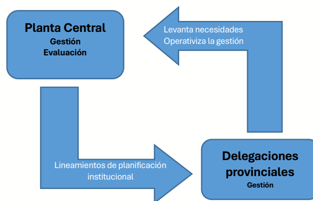
Ilustración 1. Relacionamiento institucional interno del CPCCS

Fuente: Análisis de Presencia Institucional en Territorio APIT - 2025 Elaboración: Coordinación General de Planificación Institucional